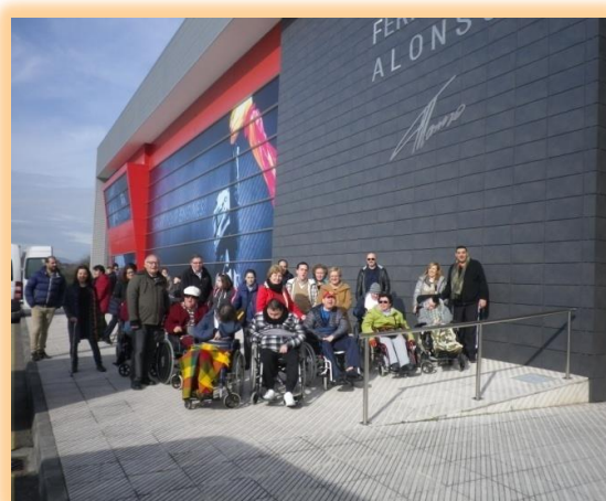
Cuadro 3. Salidas culturales 2017